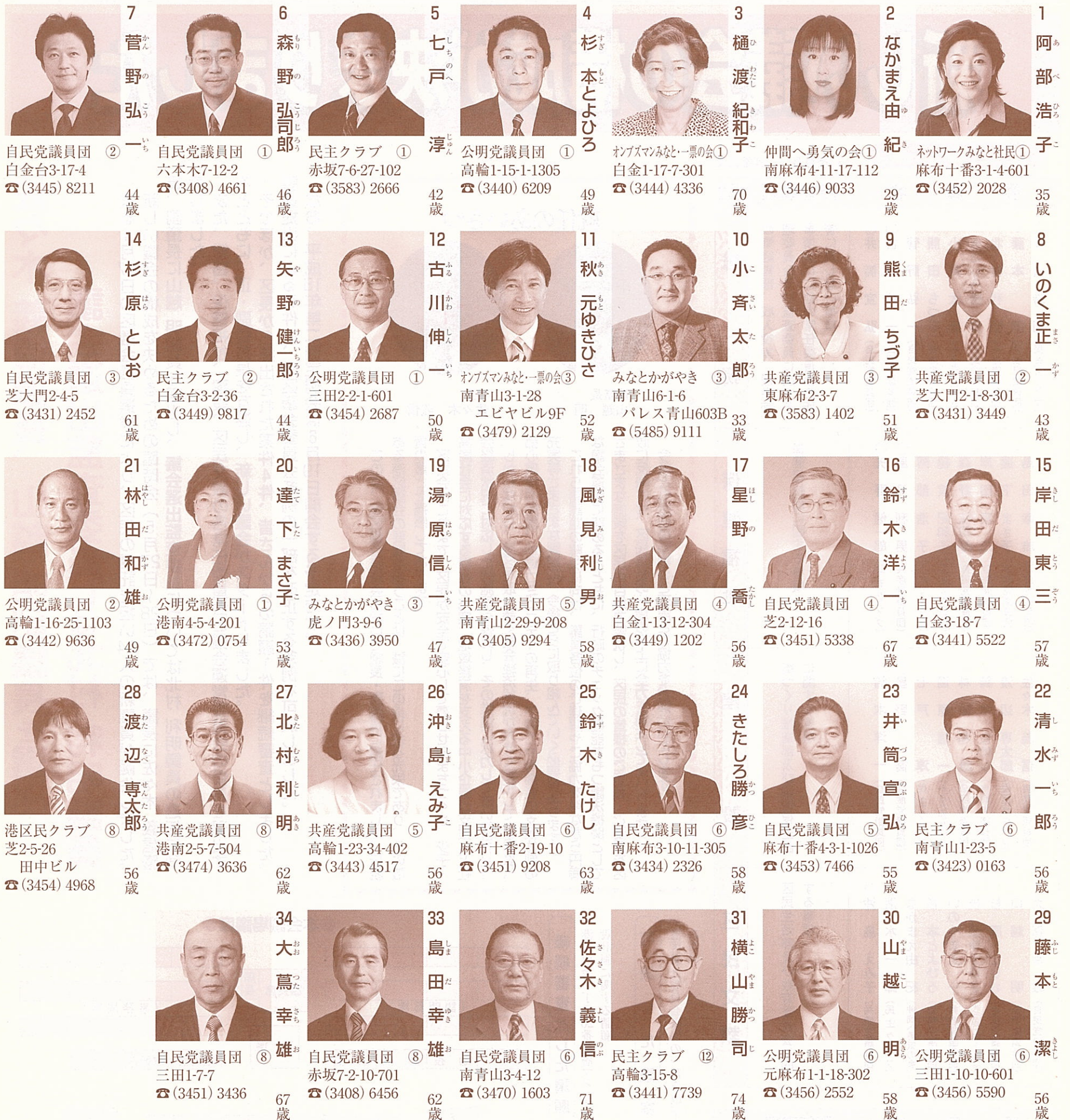
写真 所属党派 住所 電話番号 (凡例) 氏名 議席番号・氏名 年齢(5月1日現在)