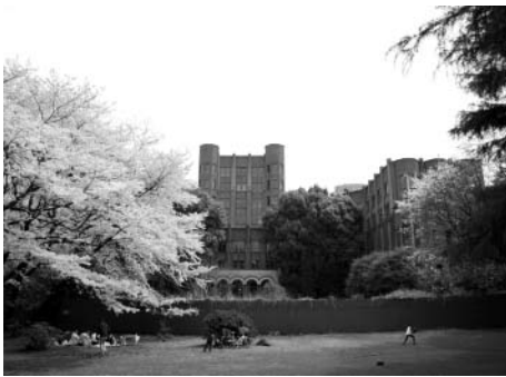
▲旧国立保健医療科学院の活用を

と友好交流協定を締結した地方都市とで可能性を協議する。地域特有の生かし方について 地域の活性化を目指すうえで、地域の魅力を最大限に発揮し、発信することが大切。 答弁 地域の魅力の一層の向上につながる事業を進める。 緊急融資制度認定事業者の状況把握について 質問 ①認定事業者の融資の実態は。②今後の区の対応について。 答弁 ①区内金融機関との連絡会で、中小企業への融資の全体的状況等の把握に努めている。②効果的な支援策に取り組む。 地上波デジタル化について 質問 地上波デジタル化による共同アンテナ利用者への対応は。 答弁 区は当事者間で解決してもらう事が望ましいと考えている。必要な相談や情報提供はする。 二世帯住宅助成制度について 質問 二世帯住宅助成制度を行えないか。 答弁 費用対効果等の観点も踏まえ、今後の研究課題とする。 高輪二丁目宮内庁宿舎跡地整備について 質問 ①取得後の整備方針は。②地域一帯の自然を保護・保全していくべきではないか。 答弁 ①高輪二丁目児童遊園との緑のつながりにも配慮し、宿舎跡地の斜面緑地の保全と復元を基本とする。②区民参画の手法