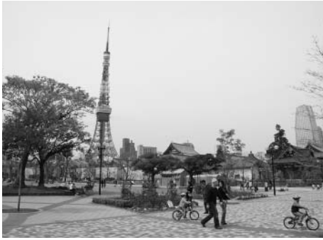
▲港区にふさわしい景観を

答弁 ①新たな組織編成で、地域における課題解決機能の充実、地域事業の定着など総合支所を中心とした執行体制の充実を図る。②総合支所と支援部との連携を強化する中で、業務マニュアルの整備や研修を充実させ、サービスの向上やノウハウの継承などに役立てる。③支援部は、平成22年4月に基本計画における各分野に合わせた執行体制に再編整備する予定。本年3月下旬に中間案を示す。