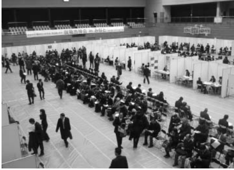
▲大盛況の港区就職面接会