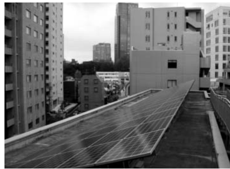
▲太陽光発電システムの導入拡大

質問 ①普及拡大に向け広報紙での説明や省エネセミナーを実施。②集合住宅でも使いやすい制度となるよう改善・検討。③高出