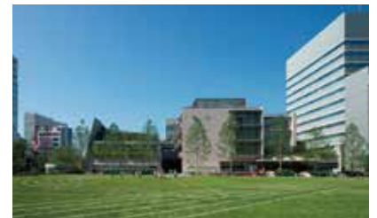
芝浦小学校の校庭