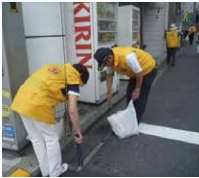
「みなとタバコルール」啓発キャンペーン