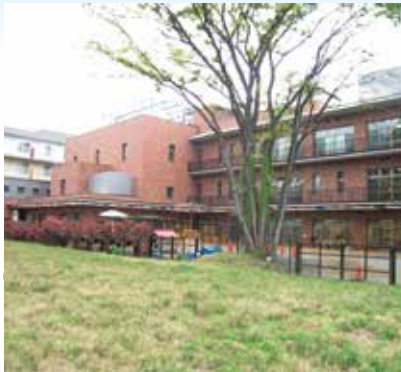
建設予定地（奥は本村保育園）