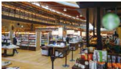
図書館にカフェを導入している事例 (佐賀県武雄市)