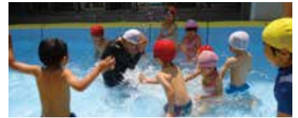
港区立芝公園保育園