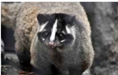
生活を脅かす動物（ハクビシン）