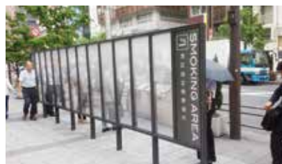
指定喫煙場所（大門駅A6出口付近）

A. わかりやすい表示や協働による啓発キャンペーンを通じて、今後もみなとタバコルールの浸透に努めていく。