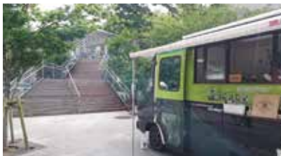
障害者の就労を支援する Shibuya Park Cafe

A. 公園へのニーズも変化し、色々な団体から公園等を活用したイベント開催の要望もある。今後、イベント開催における公園等の使用を緩和する仕組みを検討する。