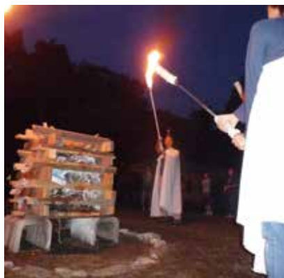
キャンプファイヤー

A. 今年度の移動教室は、葛飾区が運営する、栃木県・日光林間学園で、11月から3月までの期間、2泊3日で実施する。また夏季学園は、板橋区が運営する、群馬県・榛名林間学園で、7月から8月の期間、1泊2日で実施する。