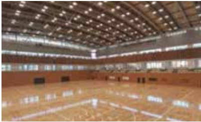
スポーツセンター（アリーナ）