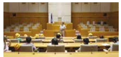
小学3年生の議場見学